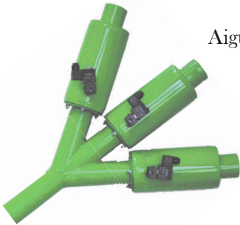
Aiguillages de refoulement 2 D et 3 D ø 60 mm