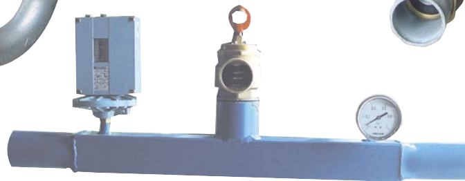
Rampe distribution d'air