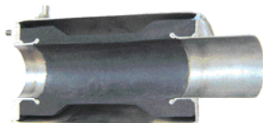
Vanne de type industriel vue en coupe