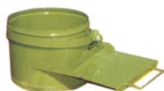
Trappe de vidange mécanique